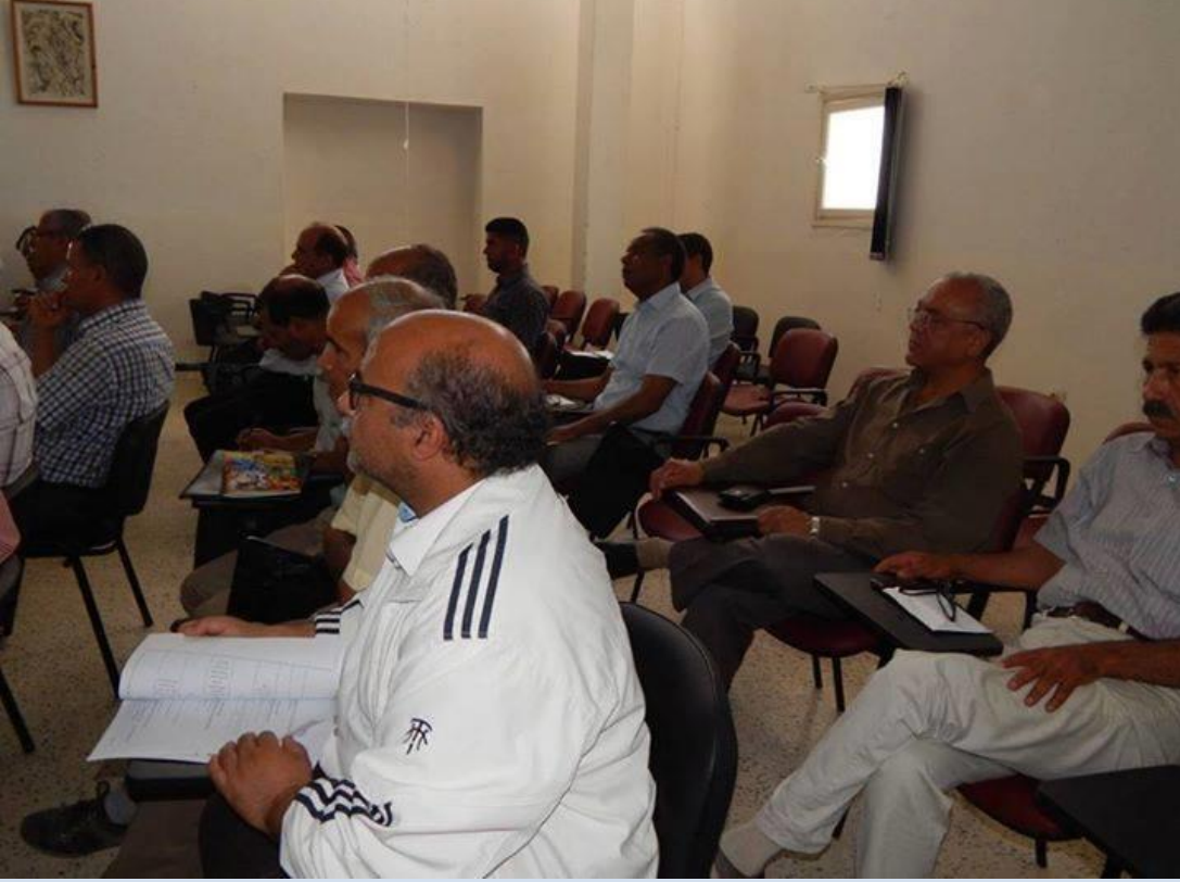
جانب من الحضور