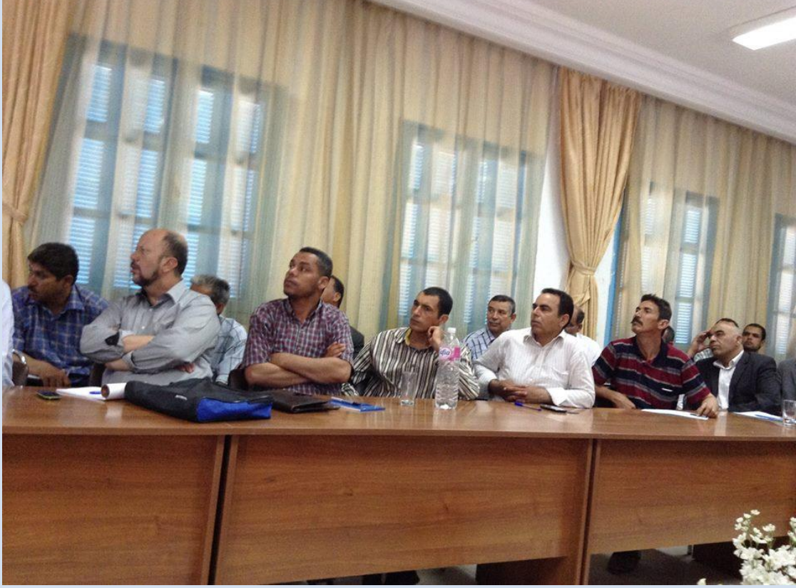
جانب من الحضور من المربين والمديرين