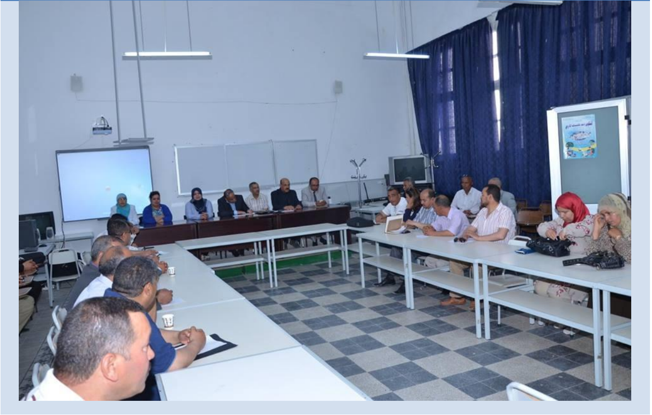
جانب من الحضور في الكاف