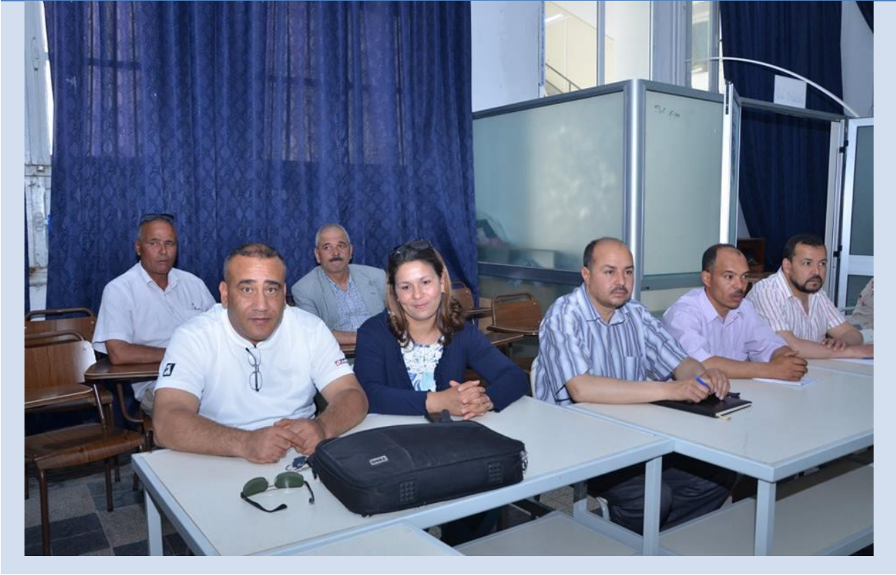
السادة الحضور أثناء الاستماع للتعريف بالمشروع