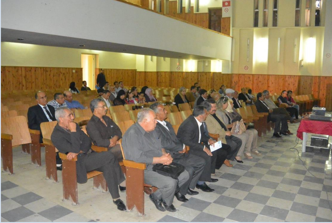
مجموعة من الحاضرين