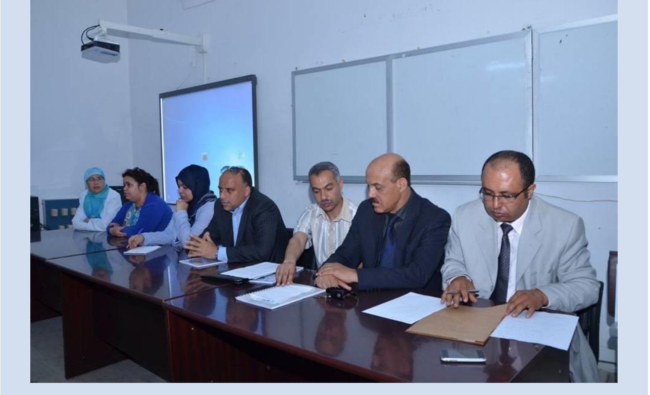
فريق الفضاء الرقمي صحبة المندوب الجهوي للتربية بالنيابة والمنسق الجهوي